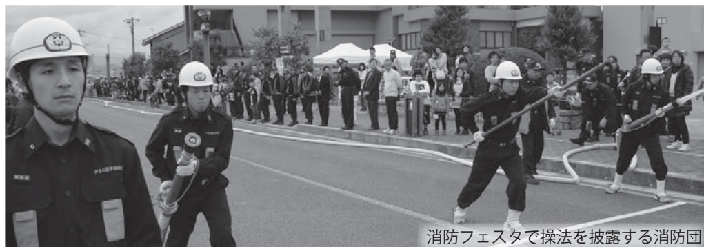
消防フェスタで操法を披露する消防団