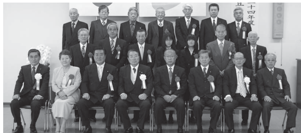
受賞者の皆さんの位置

また、今年度は、スポーツ・技芸で全国大会や県大会で優秀な成績を収めた成人・高校生・小中学生を称えるとともに、今後の活躍を期待するため『奨励賞』を設けました。平成24年度伊豆の国市奨励賞の受賞者はホームページをご覧ください。