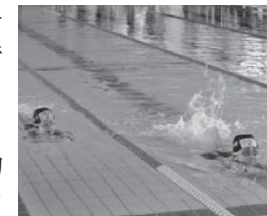
5日間で見違える泳ぎに!

初めての『サンゆうプール』短期水泳教室です。5日間、毎日練習することで苦手が克服できる!! 泳ぐことに自信がない幼児から高校生まで参加できます。