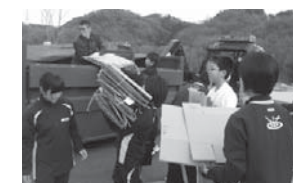
◀ごみを回収する大仁中学校の生徒

廃棄物対策課 ☎ 055-949-6805 (環境衛生課から申請窓口が変更になりました)