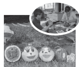
職員制作によるスイカアートの作品

▼初めて制作したスイカアート。市の旬の特産品を元気に楽しく紹介したいと思い挑戦してみました。撮影に際し、快く協力してくださった農家さん、本当にありがとうございました。撮影終了後は、みなでおいしくいただきました。遠くまでおいしく、いた