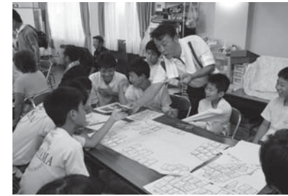
災害時を想定してシミュレーションを行う中学生(昨年原木区)

9月1日は防災の日、8月30日から9月5日は防災週間です。市内では、8月31日(日)に各地区で防災訓練を行います。当日の午前8時30分に、訓練地震発生の場合として、同報無線のサイレンを鳴らします。積極的に訓練に参加しましょう。