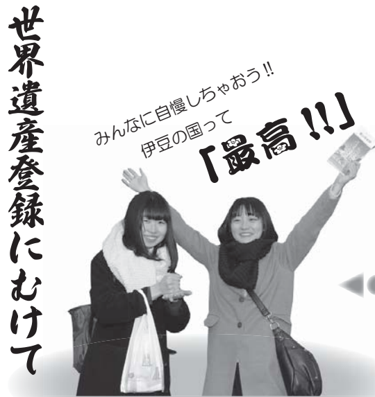
【ガイドの説明を受けた人】