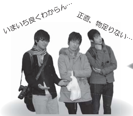
【ガイドの説明を受けてない人】