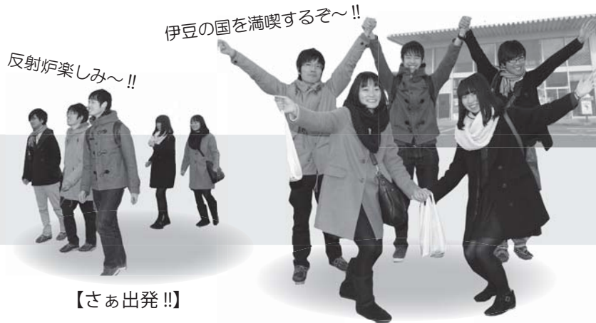
【伊豆の国市に到着!!】 (観光に訪れた学生グループ)