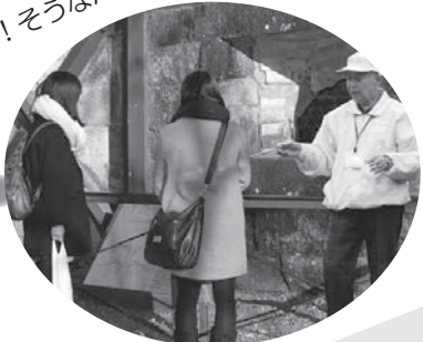
【ガイドの説明あり】