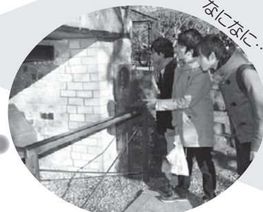
【ガイドの説明なし】