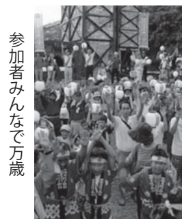
参加者みんなで万歳

▼今年の夏はとにかく暑い。子どもの頃、気温が35度を超える猛暑日なんてこんなにありませんでした？地球温暖化をいよいよ実感。どうなるこれから地球？ ▼取材に行くのもある程度慣れ、この夏にあったお祭りなどもいろいろ。満足な一方、暑さにやられて夏バテ。ううん... 国