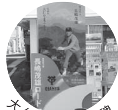
大仁駅前の記念碑

現役時代に伊豆の国市（旧大仁町）で自主トレーニングを行った長嶋茂雄読売巨人軍終身名誉監督と、伊豆の国市の関係を後世に伝えることを目的とした「読売巨人軍長嶋茂雄ロード等整備事業」が平成28年2月末をもって完成。完成記念のセレモニーを現地で行います。また、同日、第7回城山さくらまつりも行われます。