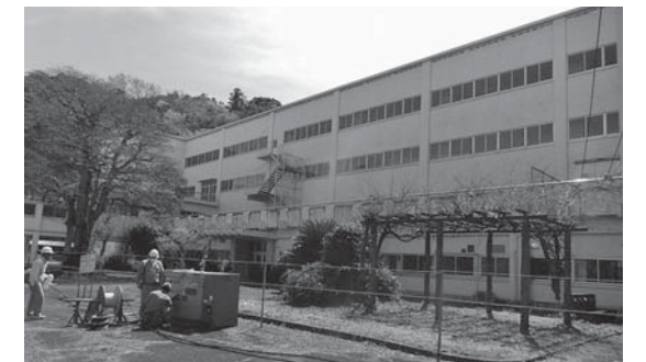
整備が進められている旧大仁高校

※伊豆長岡庁舎では受付できません。 ※市施設の新規利用にあたっては、事前にあやめ会館で利用者登録してください。（既に登録済みの場合は不要）