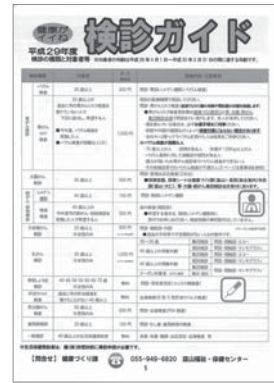
詳細は検診ガイドでご確認ください

自分の健康を守るために、まずは検診を受けましょう。検診は、市役所と各医療機関が連携して行っています。精密検査の結果は、関係機関で共有されます。