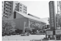
アクシスカつらぎ

・既存の小学校は存続しますが、少子化の進展や災害に対する施設の安全性など、地域の状況を考慮し、施設の統廃合などの議論も必要であります。