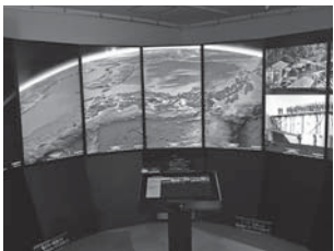
タッチパネルで興味・関心がある対象を自由に視聴