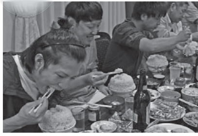
菰山多田地区の伝統行事「山の神講」

11月下旬から、市内公共施設などに全プログラムを掲載したカタログを配架します。広報12月号にも全プログラムを掲載します。受付開始は12月11日。皆さんお楽しみに！