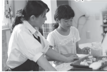
伊豆の国の特産品を使ってパン作り