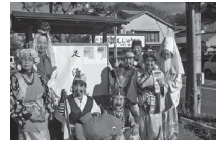
温泉場お散歩市と七福神めぐり