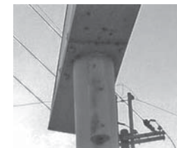
さび色の水が垂れたような跡（内部が腐食しているかも）