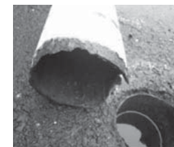
柱根元のさび（折れて倒壊するかも）