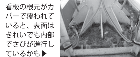
看板の根元がカバーで覆われていると、表面はきれいでも内部でさびが進行しているかも▶