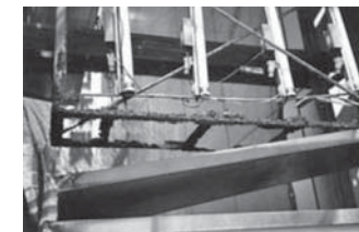
さびによる看板底部の脱落

伊豆海景 キレイな景観大好き。 最近、ステキな看板にキョーミあり。 カメラを持ってまち歩き。