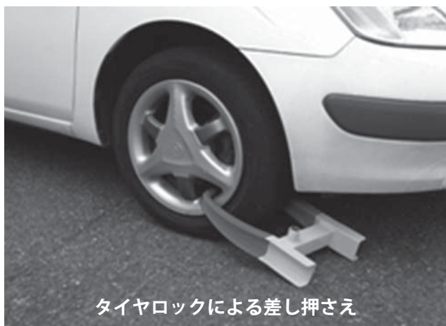
タイヤロックによる差し押さえ

督促状送付後も納付しない人には、催告書や電話などで納付をお願いします。それでも納付しない滞納者には、不動産、動産、預貯金などの差し押えを行います。差し押さえは個人(または法人)の生活・経済活動に大きな影響を及ぼす大変厳しい強制処分です。差し押さえた物件は、インターネット公売などを利用して売却する強制換価処分を行います。