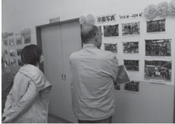
開園から閉園まで52年分の卒園写真などが展示されました

▼30年ぶりの編集に苦闘の毎日。鉛筆は「入カキ」に、定規は「マウス」に、ネガは画像データに変わってしまいました。でも、私はすぐに変われませぬ。編集期間が過ぎ去るの、あつという間です。前月号の編集後記を昨日書いたと錯覚するくらいあつという間です。1日がもう1時間あればいいのに。