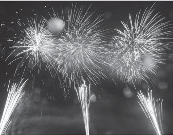
昨年は雨のなか開催しました

きにゃんね大仁夏祭り とき・ところ／8月1日(水) ※雨天決行。荒天時は5日(日)に延期。 ①大仁駅前商店街の歩行者天国 14時〜 ②花火打ち上げ 19時45分〜20時30分 (狩野川大仁橋下流200m付近) 観覧料 1マス 30,000円 (定員10人程度。敷物はご持参ください) メッセージ花火 1口 5,000円 ※駐車場はありません。 ※公共交通機関をご利用ください。 ◎伊豆の国市商工会 大仁支所 ☎0558(76)3060