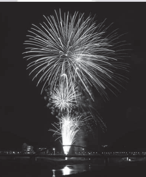
狩野川に写った花火もきれいです

とき／8月1日(水) 18時30分〜 (松明がともるのは18時45分) ※雨天中止 ◎伊豆の国市観光協会 ☎055(948)0304