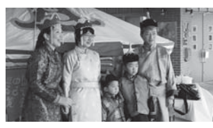
前回の伊豆の国ふるさと博覧会

て飲みます。各家庭では新鮮な野菜を使った料理が人気です。中でも野菜スープ。味はシンプルな塩味で、ダシはもちろん羊の骨付き肉を煮込み、野菜をたっぷり入れます。 さて、伊豆の国市友好都市交流協会では、10月13日と14日に葦山時代劇場ひだまり広場に本格的なゲルを設置し、モンゴル文化に触れる体験プログラムを開催します。伊豆の国ふるさと博覧会 「秋」の楽しいイベントの一つとして準備をすすめていますので、皆さん、ぜひ遊びに来てください。