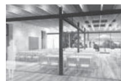
木を使った 温かみのある 待合室▶