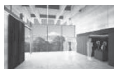
◀富士を望む 告別ホール