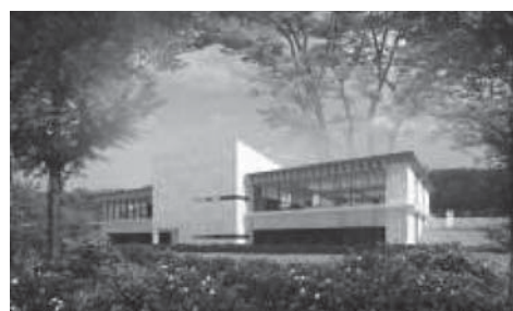
▲シンプルな北西側外観