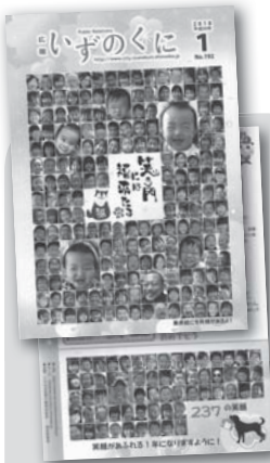
237の笑顔が飾った 平成30年1月号