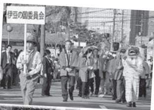
▲▲▲▲▲ 今年のガラシヤ祭のパレードの様子