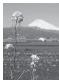
菜の花 (富士を背に)

▼山々が新緑をまとうころ。紅紫色のシランが、まばゆいほどの陽光を浴び、わが家の同じ場所に今年も咲くはず。去りゆく平成と新たな時代を祝って。隣りわすか。新しい時代が始まります。どんな時代になるうとも、変わらず、懸命に駆け抜けていくころ、と心の中