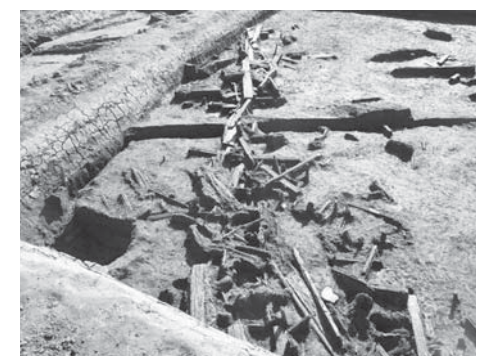
内中遺跡 2014年発掘調査 (南條、平安時代の畦畔跡)

【連載予告】 「早雲と葦山城」シリーズ始動！ 「北条早雲(伊勢宗瑞)」をご存じですか。早雲は、備中国(現岡山県井原市)出身で、戦国時代の幕を開いた武将です。もとは室町幕府の役人でしたが、駿河国(現静岡県)に招かれて力を蓄えて、葦山に進出。堀越御所を攻めて葦山城を築城すると、1519年に亡くなるまで、終生の居城としました。 今年、北条早雲没後500年の節目の年。今回の文化財通信から、新連載として、古文書や発掘調査の結果から「早雲と葦山城」の歴史について探ります。ご期待ください。