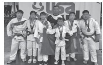
モンゴル国柔道アカデミーの皆さん