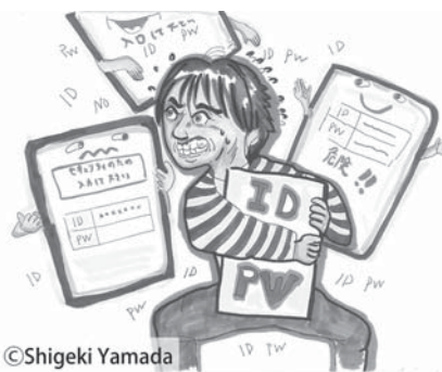
IDやパスワードの入力は慎重に！

インターネットにおけるショッピングなどの支払手段として、携帯電話会社が費用を代わりに支払い、利用者は通話料金と一緒に携帯電話会社に商品代金相当額を支払うという、いわゆるキャリア決済があります。例えば、最近、携帯電話会社を名乗るショートメッセージを消費者に送りつけ、セキュリティ上必要などとしてキャリア決済に必要なIDやパスワードを入力させ、入手したIDなどを使って、当該消費者になりすまし、ショッピングモールで高額商品の支払いに利用するといった事案が発生しています。携帯電話会社の規約では、このようなケースでは、このようなケ...