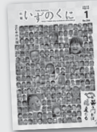
204の笑顔が飾った 平成31年1月号

『笑う門には福来たる』をテーマに、令和2年1月号に掲載する笑顔の写メを大募集！携帯電話やスマホのカメラ機能を使って、笑顔の写メをメールでご応募ください。年齢・性別は問いません。皆さんの笑顔で、新年を祝いましょう。募集要項を確認のうえ、投稿してください。