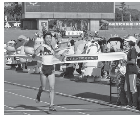
ご当地キャラに見守られてゴール

とき／11月30日(土) スタート 10時(雨天決行) コース／12区間、42・195km(県庁前～静岡市内～草薙陸上競技場)