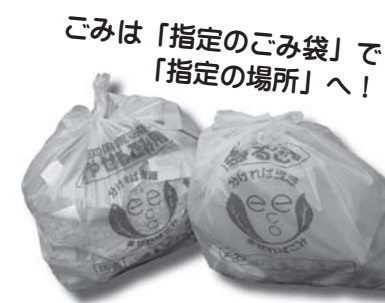
ごみは「指定のごみ袋」で「指定の場所」へ！

長岡地区・大仁地区の皆さん、11月18日～29日の期間は「最大辺が30cmを超える」ものを燃やせるごみに入れないでください