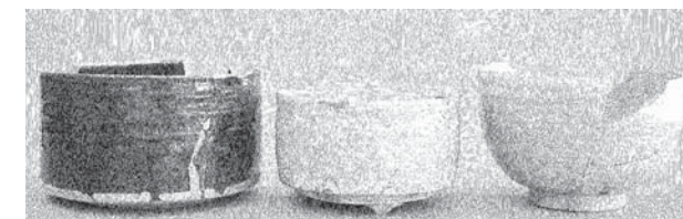
出土した香炉と陶器碗

そんな伊東街道の北東側には「高勝寺」という寺院があったと伝わっています。高勝寺がいつ頃からあったのかはつきりとしたことはわかりませんが、明治5年(1872)に住職不在で檀家もなかったことから廃仏毀釈によつて廃寺になったと伝わっています。