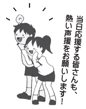
当回応援の皆さんも、熱い声援をお願いします！

申込／市HP・窓口で取得 できる所定の申込用紙を、12月2日(月)～令和2年1月7日(火)17時に提出してください。