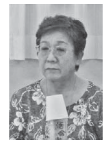
Oさん (大仁地区在住)

若年性認知症の夫の介護をしました。大変な介護をしながら自身や子どもたちのことを考える機会がたくさんありました。自分の介護経験を役立てたいと認知症キャラバン・メイトになり、地域の居場所に出向いています。今年、70歳の誕生日をきっかけに家族が集ってお祝いをしてもらうことになりました。その際、家族や親族に自分の最期をどうしたいのかを話そうと思っています。話しておくことで、これからの人生を安心して過ごせる気がしています。子どもたちも「聞いておいて良かった」と感じてくれると思います。自分の気持ちを少しずつ伝えていくことで、家族は日常生活の中で今まで以上に優しく接してくれるようになりました。