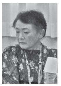
Sさん (葦山地区在住)

人生の最期の事なんて「絶対考えたくない」と思っていました。でも、こういう話を繰り返し聞いていることで、少しずつ自分の気持ちが変わってきています。「その時にはこうしてもらおう」「こうなったらいいな」「子どもが困らないように整えておこうかな」と、今では時々考えるようになりました。自分の気持ちを伝えておくことで、安心してこれからの生活を思い切って過ごすことが出来るような気持ちになっています。娘からも「ちゃんとしておいてね」とお願いされているので、家族のためにも自分のためにも、伝えておくことで安心です。