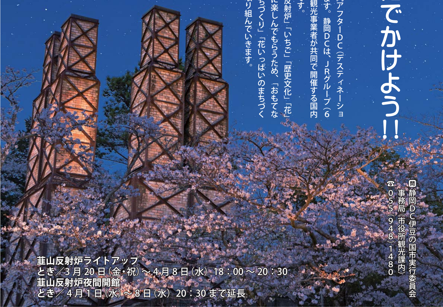
葦山反射炉ライトアップ とき/3月20日(金・祝)～4月8日(水) 18:00～20:30 葦山反射炉夜間開館 とき/4月1日(水)～8日(水) 20:30まで延長

静岡DCC伊豆の国市実行委員会 事務局(市役所観光課内) 055(948)1480