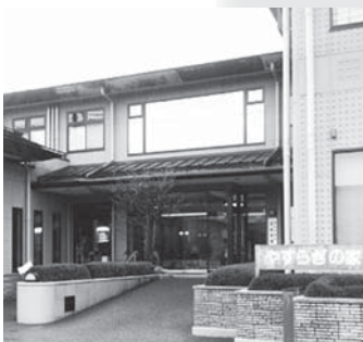
高齢者健康会館(やすらぎの家)