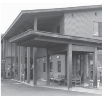
老人憩いの家水晶苑