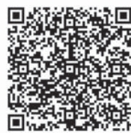
市 HP QR コード

○新料金は、4月1日以降 に予約をした場合に適用 されます。3月中旬に4月 1日以降の予約をする場 合は、変更前の料金が適 用されます。 ○すべての施設などの使用 料が値上がりするわけ はありません。新料金 の方が、使用料などが低 くなる場合もあります。 ○使用料の減免制度につ いても、見直しを行います。 この制度は、使用料など と同様4月1日以降に予 約をした場合に適用とな ります。詳しくは、各団 体を所管する市担当課へ 直接ご確認ください。