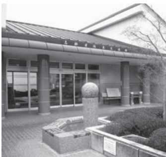
高齢者温泉交流館