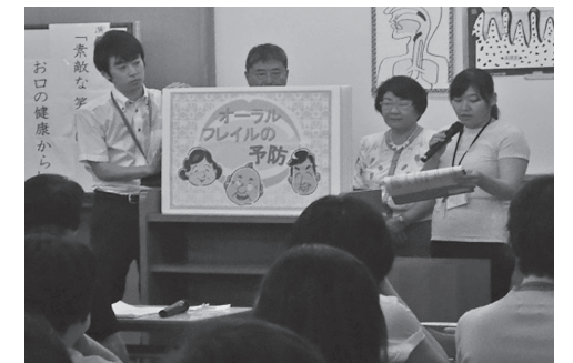
保健委員会で紙芝居を上演したときの様子