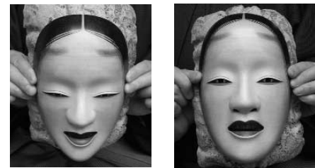
クモリ(曇り) テリ(照り)

演者の動きが少ないのは、徹底的に無駄を省き最小限の動きに省略されているからです。実は演者の動き一つの中にはいろいろな意味が凝縮されているし、無表情に見える能面にも角度を変えることによっていくつもの表情が隠れているのです。