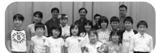
「私たちの舞台を、見に来てください」

今回は、中島の民話「城山の大蛇」の創作劇でしたが、今回は江間の民話をもとにした創作能に挑戦します。