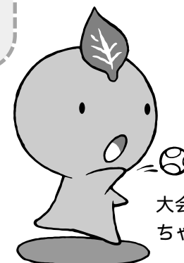
大会マスコット ちゃっぴー

の交流を図り、心温まる歓迎と盛り上がりのある交流大会と交歓試合が期待されます。これに向けて、伊豆の国市では、「ねんりんピック静岡