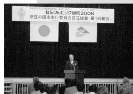
伊豆の国市実行委員会設立総会

来年十月、静岡県で「第十回全国健康福祉祭しずおか大会(ねんりんピック静岡2006)」が開催されます。ねんりんピックは、六十歳以上の高齢者を中心に卓球、水泳などの各種スポーツや囲碁、俳句などの文化交流、さらに美術展、音楽文化祭なども開かれる祭典です。伊豆の国市では、荏山運動公園でペタンク交流大会が行われます。全国から六十四チーム二百五十六人の選手や多くの応援者の来場が見込まれ、健康づくりの推進、世代間・地域間