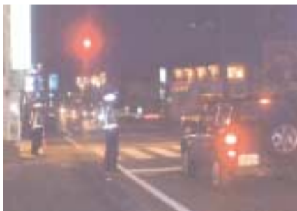
夜間街頭指導など、様々な活動で交通事故防止に努める交通指導員会