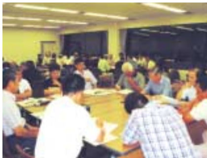
各部会に分かれ抱負を述べる参加者

七月二十日夜、伊豆長岡庁舎会議室で、「伊豆の国ゆめづくり市民会議」の初会合を開きました。この会議は、市の総合計画策定のために、広く市民の意見を聞くことが目的で、一般公募で集まった市民と市内の各種団体からの推薦者計八十一人の委員で組織されています。参加者は自然・