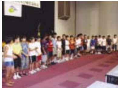
結団式で初顔合わせした候補選手たち。写真は小学生の候補選手