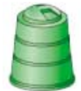
生ごみ堆肥化容器 (コンポスター)