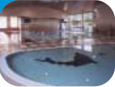
長岡温水プール 電話 055 947 0176