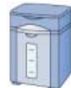
生ごみ処理機 (バイオ式)