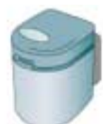
生ごみ処理機 (乾燥式)

対象となる生ごみ処理機等を購入して下さい。購入の際に購入店からカタログ・保証書・領収書(レシートは不可)をもらってください。各支所の地域振興課で補助金の申請をして下さい。所定の申請書と請求書へ記入をお願いします。そのときにカタログ、保証書のコピー、領収書、印鑑、申請者本人の振込先口座番号(郵便局は不可)がわかるものをお持ちください。