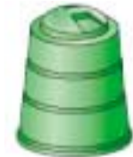
生ごみ堆肥化容器 (コンポスター)