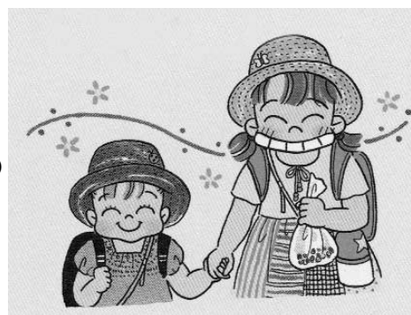
「高野優のおひさまランドセル」(講談社刊)より