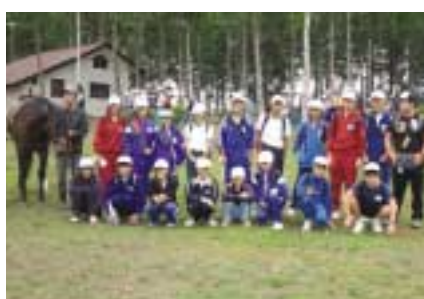
彼らを成長させた北海道の貴重な体験

この夏、第五回静岡県東部少年の船が北海道に行ってきました。この事業は、県東部の中学生を対象とした広域研修で伊豆の国市からは計十二人が参加。第一船は七月二十四日、三十日、第二船は八月一日、七日の六泊七日で、日高少年の家や大雪青年の家を拠点に、アイヌ民族文化にふれたり、土の館での農事研修や旭山動物園でのウォークシート研修、ケンタッキーファームでの馬とのふれあいを行い、中学生同士の共同生活を体験してきました。一週間の