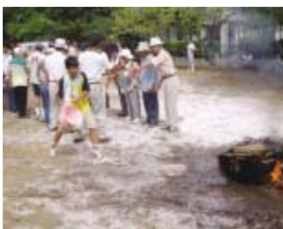
自主防災会では、地震を想定し、地区ごとに計画した内容の訓練を実施

また市役所では、災害対策本部を設置し各支所に職員を動員。救護所開設、田方消防署員による救急救命訓練、各地区急傾斜地危険区域や水道施設パトロールに伴う無線交信訓練などを実施し、有事に備えました。