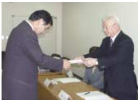
助役より委嘱状の交付を受ける委員

十月二十七日、伊豆長岡庁舎会議室で、第一回「伊豆の国市行政改革推進委員会」を開きました。これは、市の行政改革の推進について、広く市民の意見を取り入れるために設置した市長の諮問機関で、委員は、市民有識者や