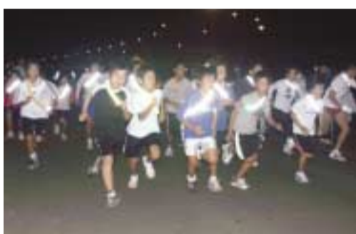
本番が近づき、練習に熱が入る候補選手団

第6回静岡県市町村対抗駅伝競走大会 12月3日(土) 10:00 スタート 県庁前～静岡市内～草薙陸上競技場 (10区間 42.195 km) SBSテレビ(生中継) 9:30～12:50 (11:45～12:00は、ニュースのため中断) SBSラジオ(完全生中継) 9:45～13:00