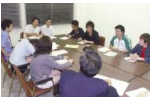
写真は10月21日の菰山地区実行委員会の様子

来年一月八日(日)開催の伊豆の国市成人式に向けて、実行委員会が始動しました。すでに広報でお伝えしたとおり、平成十八年度の成人式