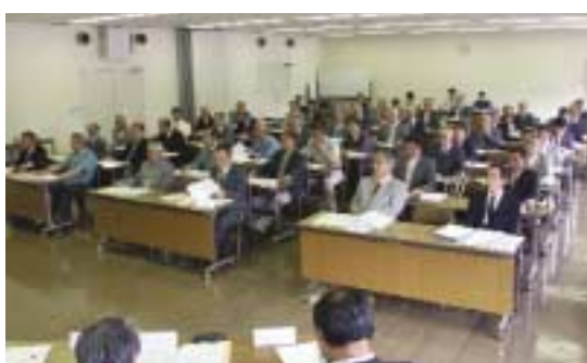
市内全域の区長が一堂に会した区長全体連絡会

毎年、大型の台風が上陸し、東海地震の発生も叫ばれる中、市民が安心して暮らせる「災害に強いまちづくり」を進めていきます。