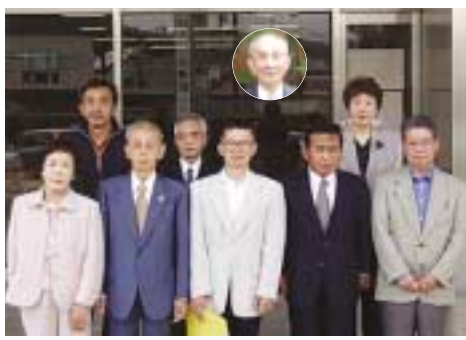
身体・知的相談員(名前と連絡先は左表参照)