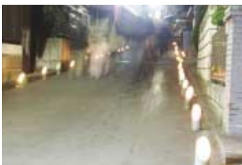
幻想的な竹灯り(写真は古奈・湯谷神社付近)

十二月三十一日から一月一日にかけて、伊豆長岡地区の神社等は、竹の灯りで照らされました。これは、「竹灯りの路「灯りやんせ」と呼ばれ、旧伊豆長岡町時代の伊豆新世紀創造祭のときからの行事。竹灯りの正体は、斜めに切った竹筒に水を張り、玉ろうそくを浮かべて、ほのかな灯りが揺れ動く、というものです。