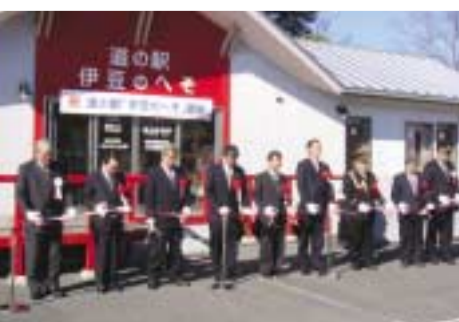
開所式でテープカットする市長(一番左)ら

施設内には、ロケミュージアムのほか、伊豆の国観光協会(大仁観光案内センター)とフィルムコミッション伊豆の事務所を併設。伊豆全域の