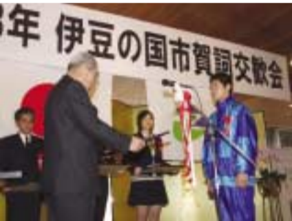
市長から表彰される受賞者ら

式典では、昨年、市の振興に寄与した団体・個人を表彰(受賞者名と表彰事由は下表のとおり)。また、市長は出席者への新年のあいさつで、平成十八年度は、安心・安全・安定したまちづくりを目指し、教育・子育て支援、福祉・保健の充実、地域産業の