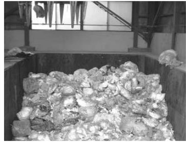
葦山焼却場のごみピット