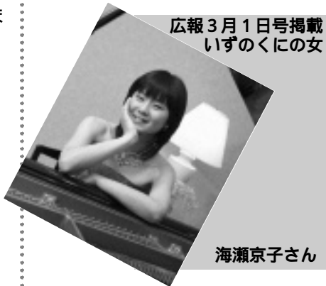
広報3月1日号掲載 いずのくにの女

ところ / 葦山時代劇場大ホール 入場料 / 自由席・一般 1,000円 高校生以下 500円 好評発売中