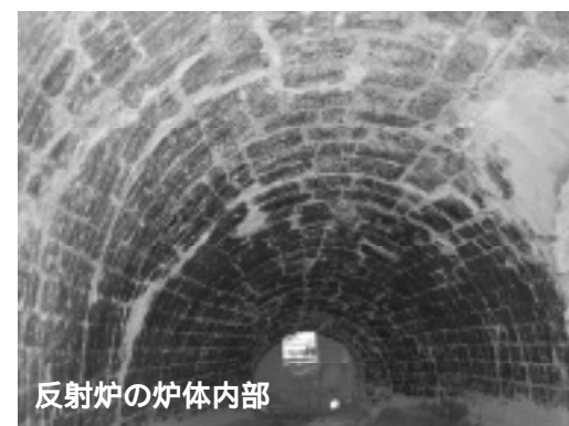
反射炉の炉体内部

鉄の溶解温度千五百度以上を出すように工夫されているため、反射炉と呼ばれています。炉は伊豆石で造られ、二基ずつ、四基がし字状に配置されています。その上に煉瓦で積まれた十五・六メートルの煙突が乗っています。