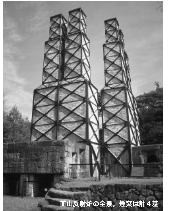
葦山反射炉の全景。煙突は計4基

今月から、市内の指定文化財を国指定、県指定の順に紹介していきます。第一回は、国指定史跡の葦山反射炉です。