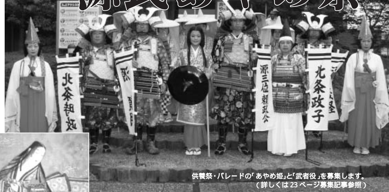
供養祭・パレードの「あやめ姫」と「武者役」を募集します。 (詳しくは23ページ募集記事参照)