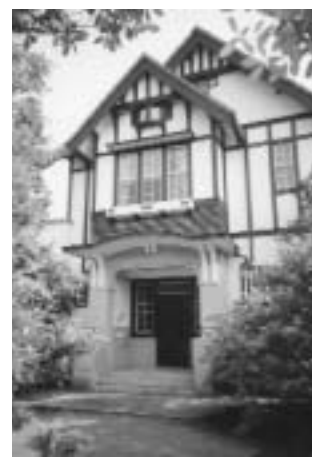
中川家住宅主屋外観

幸せの方程式などな い。情熱と志で切りひ らけ。タフに生きる本物の起業家 25人に学ぶ仕事を人生を楽しむた めの究極の教科書。 【中央図書館所蔵】