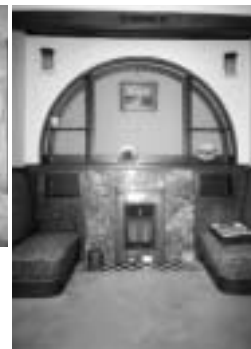
(寝室のイングルヌック)

のご好意により主屋の内部も 一部公開しますが、建物の保 存上、人数を制限させていた だきます。住宅の詳細につい ては、広報三月一日号の文化 財通信をご覧ください。