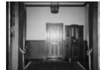
主屋内部(玄関ホール)