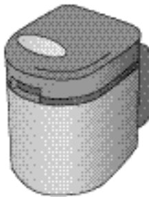
生ごみ処理機 (乾燥式)