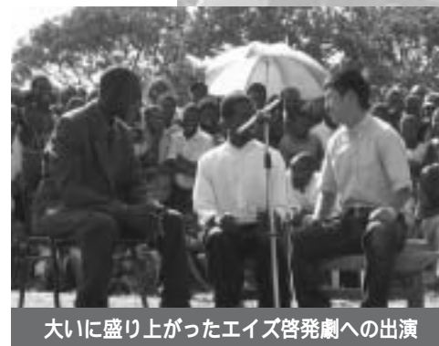
大いに盛り上がったエイズ啓発劇への出演

もありません。そんな数カ月が過ぎ、ユース活動というものがわかり始めたころ、商売を始めることにしました。イベントや作業は毎日はないので、日々の彼らは暇を持て余しています。そんな時間を利用して、特産品を使ったお菓子づくり挑戦することに。ここまで来るまでには何度も話し合い、何が我々にとって有益なのかを考えました。家具を作る、卸売りをやる、などなど。最終的にこのお菓子づくりになったのは、売れる喜びを頻繁に感じることが出来る、子どもから大人まですべての人が顧客対象になる、他にはない我々独自の商売ができる、というのが理由。現在進行中のこの商売。果たして成功するかは数カ月経って見ないとわかりません。とりあえず焦らずゆっくり（アフリカでは基本です）、多くの人に知ってもらうことが大切であると思っています。