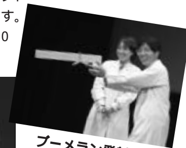
ブローラン発射機