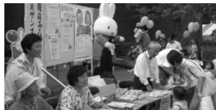
市民のために頑張る歯周病予防対策委員さんたち

伊豆の国市では「伊豆の国市歯周病予防対策委員会」を設置し、市民の歯周病予防対策を企画・実施しています。そこで、市民代表として委員会に参加していただける人を募集します！一緒に、健康のための活動してみませんか？ぜひ、お申し込みください。