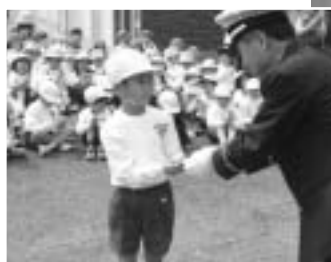
子どもたちの安全を願ってマスコットを作りました