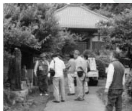
社寺調査のようす

あわせて、2巻以降の近現代、遺跡、石造物、社寺等の調査も行われます。関係する皆様のご協力をお願いします。